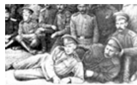
Сергей Есенин в армии среди военных санитарного поезда (1916)

«...Я понял, что я — игрушка, В тылу же купцы да знать, И, твердо простившись с пушками, Решил лишь в стихах воевать,